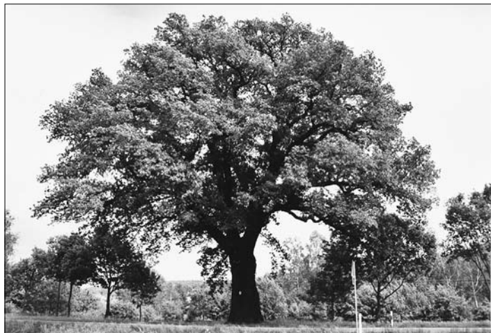
Die 500-jährige Eiche vor ...

Es gibt viel wichtige Dinge, die unsere Lebensqualität ausmachen. Unsere Bäume gehören an vorderster Stelle dazu. Der unzählige Aufwuchs versucht sich selbst zu behaupten.