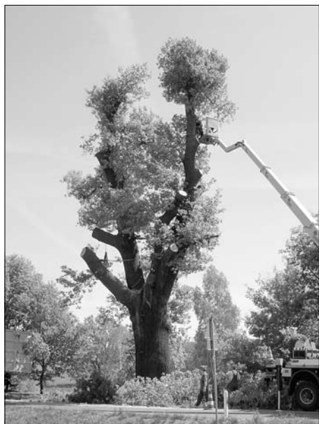
... und nach dem Eingriff

Die laufenden Veränderungen unserer Lebensumstände und –gewohnheiten sorgen aber auch für eine zunehmende Verantwortung des Menschen für seine Umwelt und die Sicherung wichtiger Existenzbedingungen. Wir wollen berechtigt unser Leben nicht überorganisieren, aber ohne wachsendes Selbstbewusstsein im Umgang mit unserer Natur haben wir keine verlässliche Zukunft.