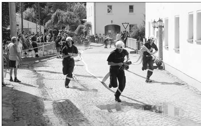
Ein Feuerwehrteam im Einsatz

Die Möhrsdorfer nutzten die Gelegenheit, um ein dreitägiges Feuerwehrfest zu veranstalten. Außer dem kulturellen Angebot gingen die Kameraden auch von einem Gründungsjubiläum der Pflichtfeuerwehr