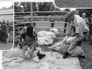
Schaf- und Wollmarkt