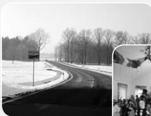
Fertigstellung der S105