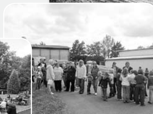
Kinderfest der Lausitzer-Agrar-AG