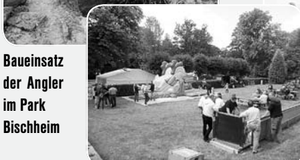
Baueinsatz der Angler im Park Bischheim