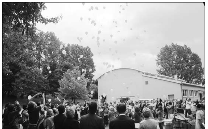
Luftballons steigen über der Sporthalle zum Himmel.