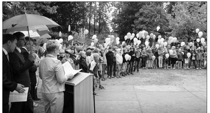
Die Bürgermeisterin spricht zu Schulkindern und Einweihungsteilnehmern.