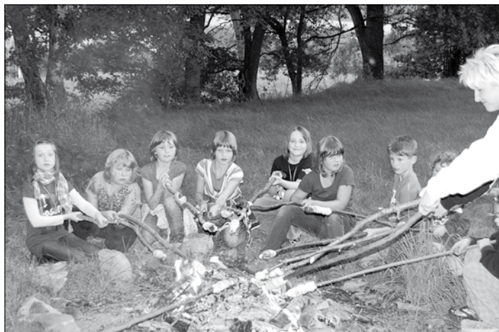
Lagerfeuer mit Knüppelkuchen

Der krönende Abschluss und Ausklang des Abends war das Lagerfeuer, über dem wir leckeren Knüppelkuchen rösteten.