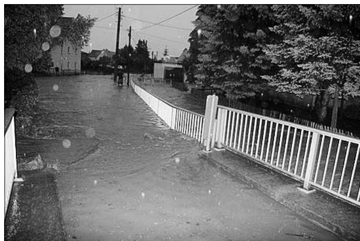
Die Veilchenstraße war besonders betroffen.

Es gab 1967 im Haselbachtal durch ein schweres Gewitter ein sogenanntes Jahrhunderthochwasser. Das Hochwasser am 5. Juli dürfte danach das zweitstärkste gewesen sein. Mit bis zu 500.000 € werden die Schäden beziffert. Sie entstanden auf privaten Grundstücken und in der Gemeinde. Sehr kostenintensiv werden die Instandsetzung der Veilchenstraße in Gersdorf sowie der zerstörten Parkanlagen in Bischheim werden.