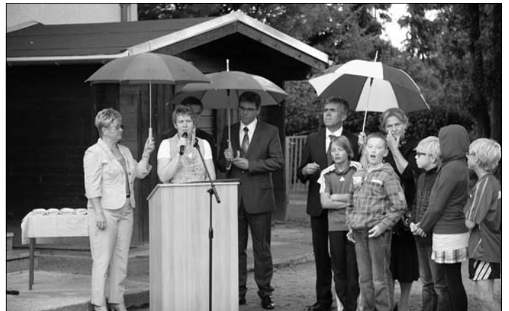
Die Schulleiterin freut sich über die großartigen Schulsportbedingungen.