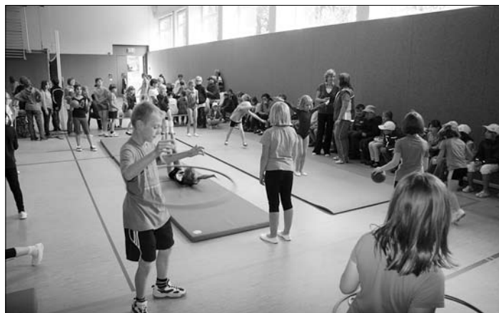
Kinder beim Schauturnen und Spielen.