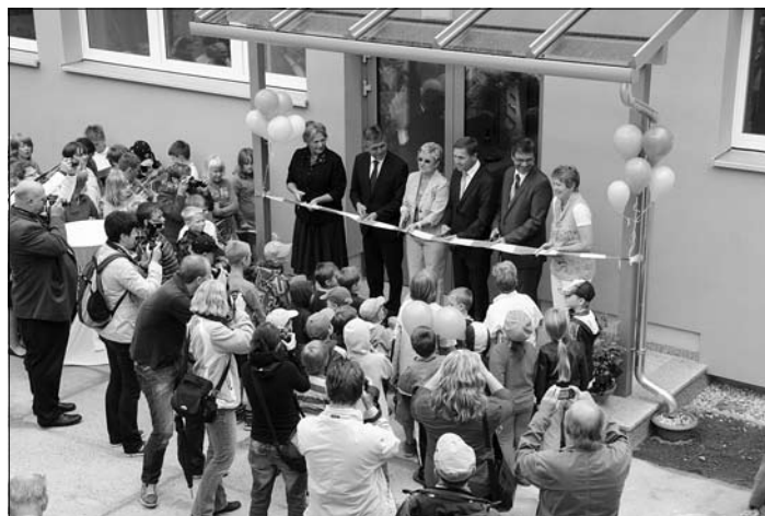
Noch Sekunden – und dann ist der Einlass frei.