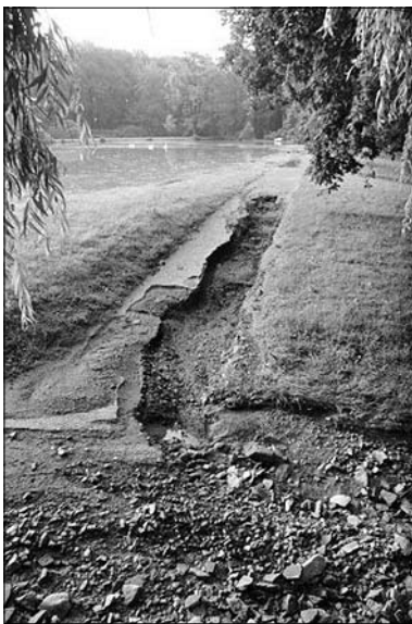
Eine Ansicht von zerstörten Parkwegen in Bischheim.

Schnell war zu erkennen, dass hier wieder alle unsere fünf Feuerwehren viel zu tun bekommen. Da die Not in Reichenbach und Reichenau begrenzt war, halfen diese beiden Wehren in den anderen Ortsteilen.