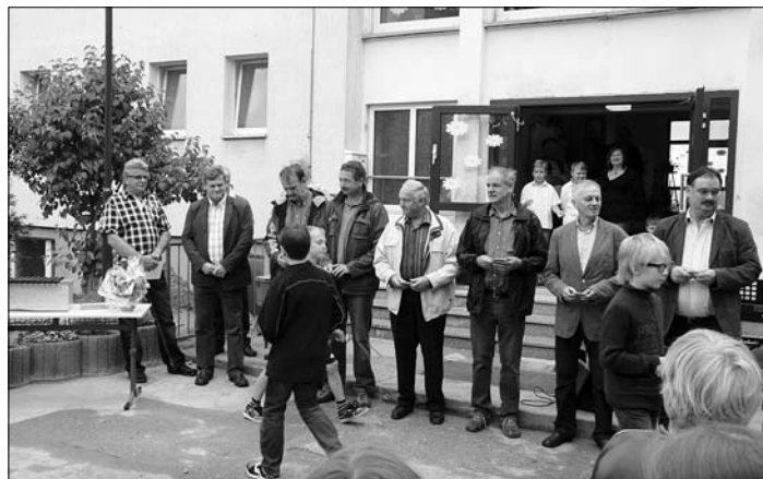
Ein herzliches Dankeschön ging an eine Vielzahl beteiligter Firmen.

Erfreuen Sie sich an ein paar Erinnerungsfotos.