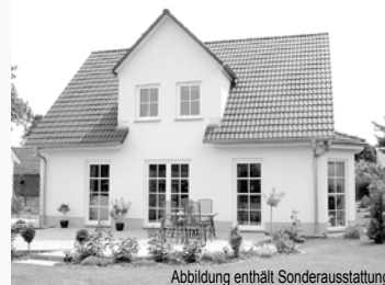
Abbildung enthält Sonderausstattung!