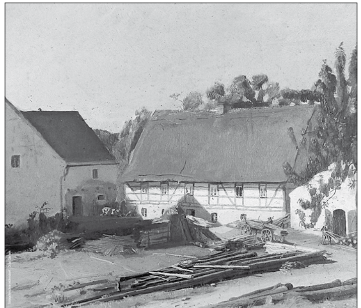
Strauchmühle Möhrsdorf, Otto Garten

Der Heimatverein Haselbachtal e.V. und die Dorffreunde Möhrsdorf e.V. laden alle interessierten Bürger zum Besuch der Ausstellung anlässlich des 750-jährigen Ortsjubiläums von Möhrsdorf ganz herzlich ein.