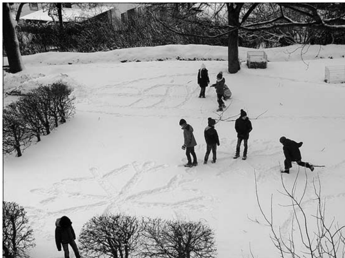
Foto Kunst im Schnee