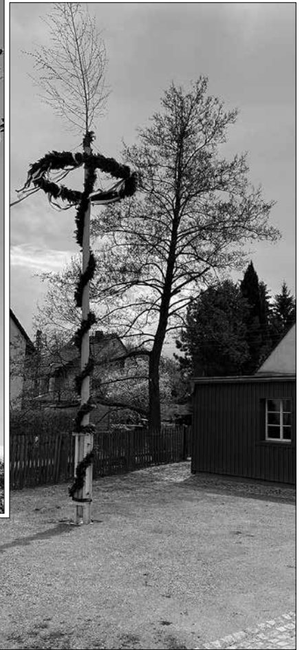
Maibaum in Reichenau

Ich bedanke mich bei den Initiatoren in Reichenbach, Reichenau und Möhrsdorf für ihren Einsatz.