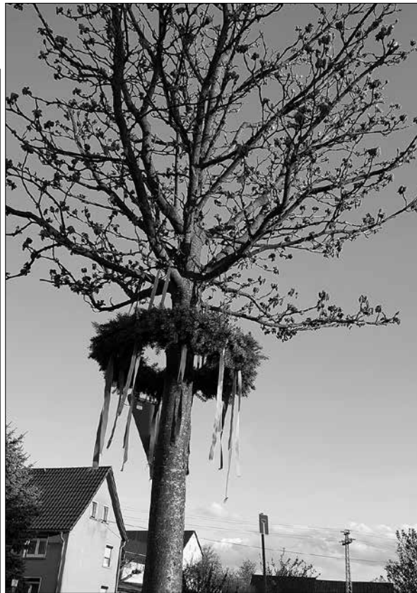
Wie schon im letzten Jahr wurde die Kastanie am Dorfplatz von den Dorffreunden Möhrsdorf geschmückt. Ein mit bunten Bändern verzierter Kranz hängt nun über den ganzen Wonnemonat im Dorfzentrum und symbolisiert den sonst gestellten Maibaum.