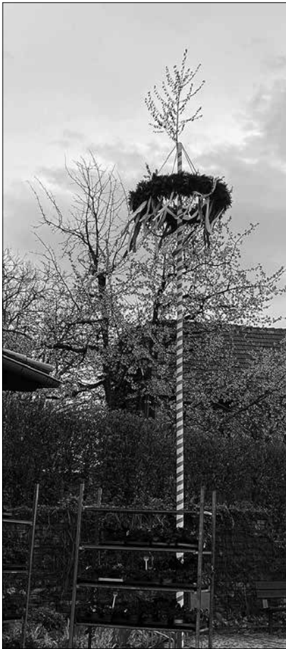
Auch am Dorfplatz in Reichenbach steht ein schöner Maibaum.