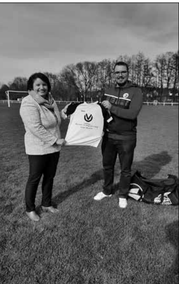
Trikotübergabe an den Trainer der E-Jugend