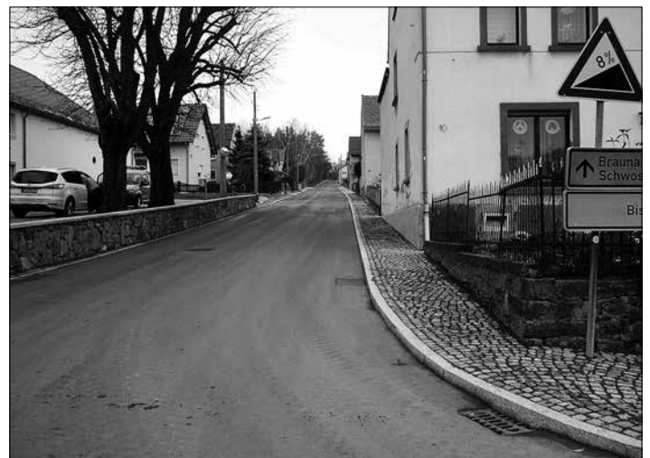
Bergstraße Richtung Schwosdorf