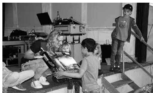
Preise für das Entenrennen