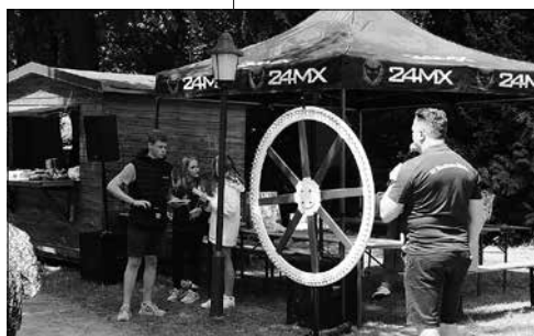
Wurstrad - SV Bischheim-Häslich