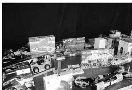
Preise für das Entenrennen