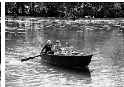
Gondeln - FFw Bischheim-Häslich