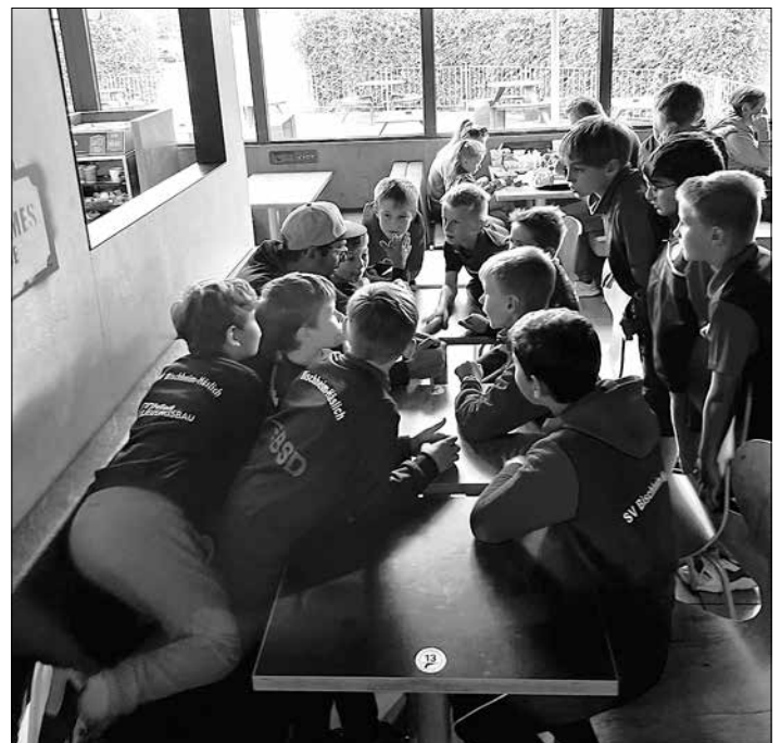
E-Jugend bei Mc Donalds