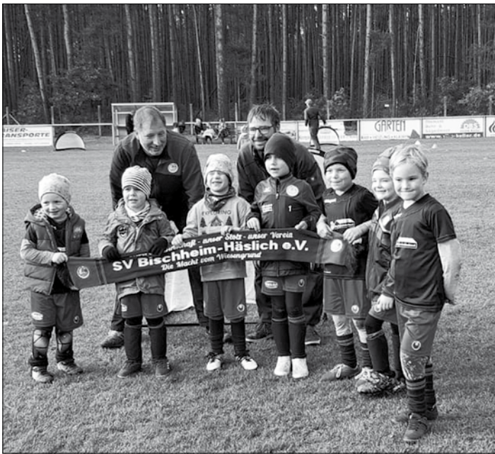
Bambinis beim Turnier in Großaundorf

Auch im zweiten Halbjahr konnten sich unsere Bambini-Verantwortlichen Katja Hain und Ronny Scholz über großen Zulauf freuen. Nach vielen altersbedingten „Abgängen“ zur F-Jugend schrumpfte der Bambinikader im Sommer auf 5 Kinder. Im Laufe des Spätsommers und Herbst stieg die Anzahl an Kindern wieder auf stolze 16 an. Die Bambinis nahmen an Turnieren in Großaundorf und Lomnitz teil und konnten ihre ersten „Wettkampferfahrungen“ sammeln.