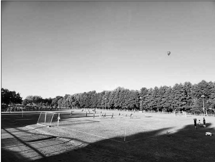
Regel Betrieb im Wiesengrund

Die Hinrunde der Saison 2023/24 ist gespielt. Wir möchten Euch in den nächsten Tagen einen kurzen Überblick über die Ergebnisse unserer Mannschaften geben. Der SV Bischheim-Häslich startete mit 2 D-Jugend Mannschaften, 3 E-Jugend, 2 F-Jugend Teams und einer Bambini Mannschaft in die neue Saison. In Summe zählen wir aktuell 107 aktive Kinder. Dies ist der Höchstwert seit der Wiedereinführung des Kinderfußballs im Bischheimer Wiesengrund im Jahr 2018. Eine Anzahl an Kindern und Mannschaften, die nur mit Unterstützung unserer zahlreichen ehrenamtlichen Trainer zu meistern ist. Dafür gilt größter Dank und Respekt!